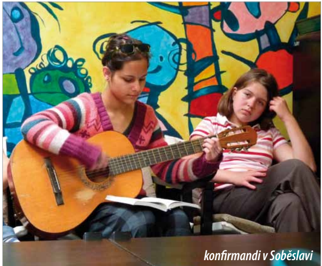
konfirmandi v Soběslavi