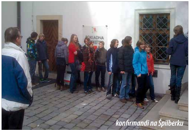
konfirmandi na Špilberku