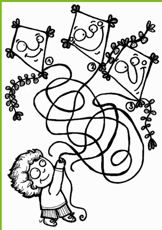
Aktivita pro děti